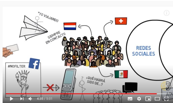
El Peligro de las REDES SOCIALES | Adición a Instagram, Facebook... 21.173 visualizaciones · 19 jun. 2019 · 1909 likes · 15 comentarios · COMPARTIR · GUARDAR

Con el siglo XXI plenamente asumido y con las nuevas tecnologías en todo los ámbitos, ignorar que forman parte de la vida de nuestros jóvenes sería poner una venda en los ojos a nuestra realidad social. Las redes sociales son una potente herramienta y un peligro que hay que controlar. Son una ventana al mundo a la que se asoman y lo que se publica se escapa para siempre de control del usuario. Por ello, debemos usarlo con prudencia ya que estos medios deben ser supervisados por uno de tus padres, de tal manera que aseguren un acompañamiento y supervisión.